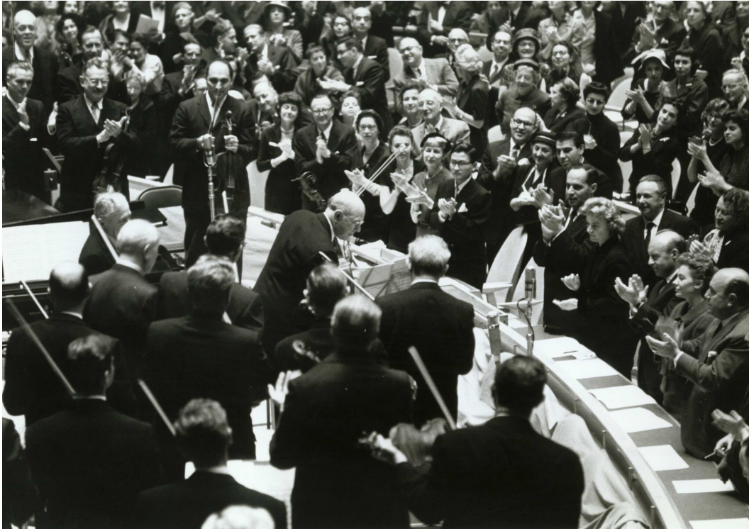
Durant el concert a la Seu de les Nacions Unides de Nova York