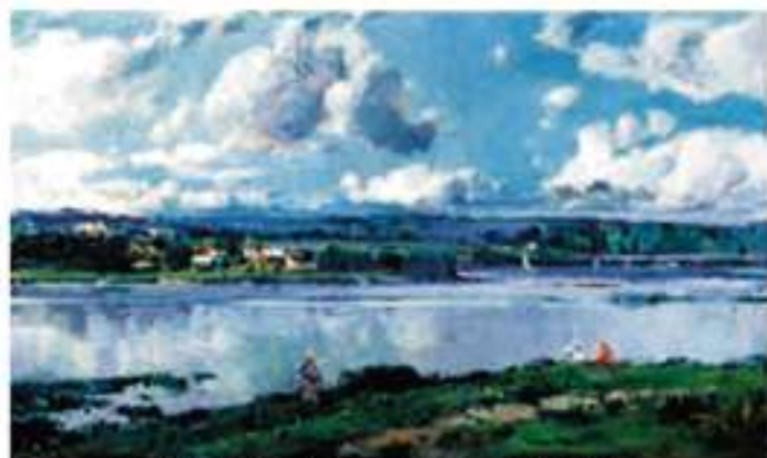
Eusebi Meifren i Roig, El Mar c.1890 Oli sobre tela 105 x 157,5 cm