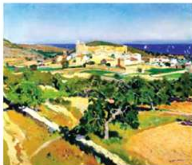
Joaquim Mir i Trinxet, Cataluña, 1928. Óli sobre tela 96 x 111 cm

Amb aquesta mostra la Vil·la Casals - Museu Pau Casals, inicia un cicle d'exposicions temàtiques adreçades a divulgar el fons d'art de la Fundació Pau Casals, format bàsicament per la col·lecció d'art de Pau Casals que ell mateix va cedir a la Fundació el 1972.