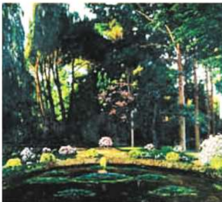
Santiago Rusiñol i Prat, Jardí d'Arbúries, c. 1899. Óli sobre tela 98 x 108 cm.

La col·lecció, que Pau Casals tenia exposada a la casa de Sant Salvador, està formada per més de 60 obres que van des del realisme de Ramon Martí Alsina, el luminisme de Joan Roig i Soler, el modernisme de Ramon Casas i Santiago Rusiñol, l'impressionisme de Joaquim Mir, el fauvisme de Pere Crèixams i Josep Mompou, fins el nou-centisme de Joan Rebull.