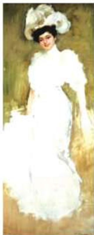
Ramon Casas i Carbó Actar Ferrer , c.1909 Oli sobre tela 188 x 79 cm