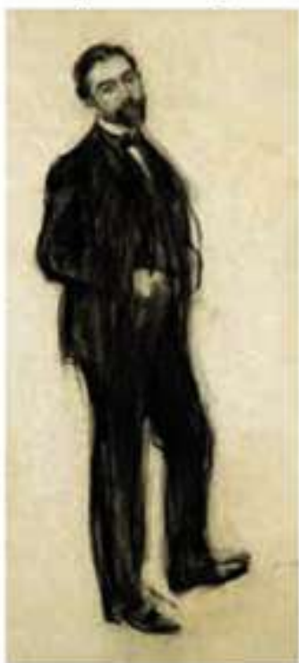
Ramon Casas i Carbó. Retrat de Miquel Bay i Fabregas. Esculdoc, c.1899. Il·l·lustració sobre paper 61,5 x 29cm

A principis dels anys vint, Pau Casals va establir la seva residència habitual a Catalunya. Assessorat per l'amic i propietari de la Sala Parés, Joan Anton Maragall, es va dedicar durant aquest anys a adquirir obra d'artistes catalans de finals del segle XIX i principis del segle XX, donant lloc a una col·lecció molt coherent on es poden veure reflectides les corrents artístiques més importants del moment.